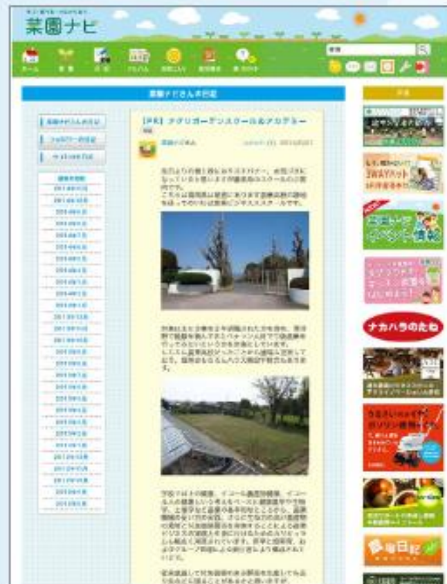
サイト内紹介記事イメージ